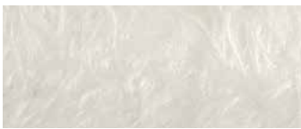
vetroresina naturale natural fiberglass

43 x 40 h45 cm - 16 3 / 4 x 15 1 / 2 h17 1 / 2 "